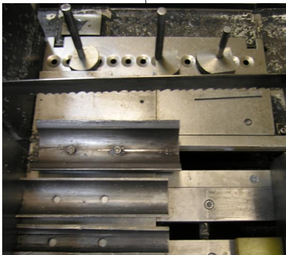
Рисунок 2. Общий вид составных частей приспособления для крепления патрубков в ленточнопильном станке

образом, что при его повороте уменьшается, либо увеличивается расстояние, на которое необходимо передвинуть патрубок (рисунок 3). На кулачки нанесена соответствующая маркировка.