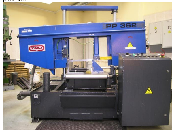
Рисунок 1. Общий вид ленточнопильного станка TMJ PILOUS PP 362

Специалистами трубной лаборатории было разработано и изготовлено специальное приспособление для крепления патрубков в ленточнопильном станке, которое устанавливается на горизонтальный стол пилы. Приспособление обеспечивает надежную фиксацию патрубков различных типоразмеров, позволяет передвигать образец в горизонтальном направлении на строго фиксированное расстояние, обеспечивает продольность и параллельность образца.